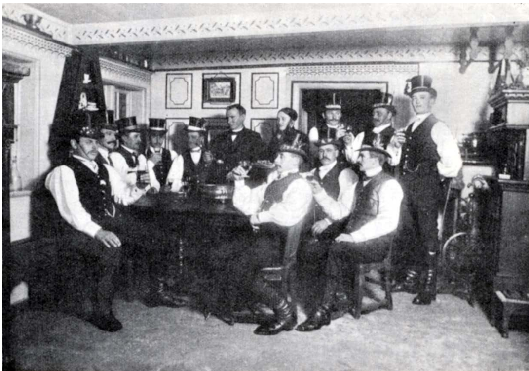
Rytterne aflægger Besøg paa "Hollandsminde".

Slag, erklæret for Tøndekonge. Denne fik nu bundet et smukt blomstret Baand om sin venstre Arm, hvilket blev udført af en af de Koner, som var med i Gildeslaget.