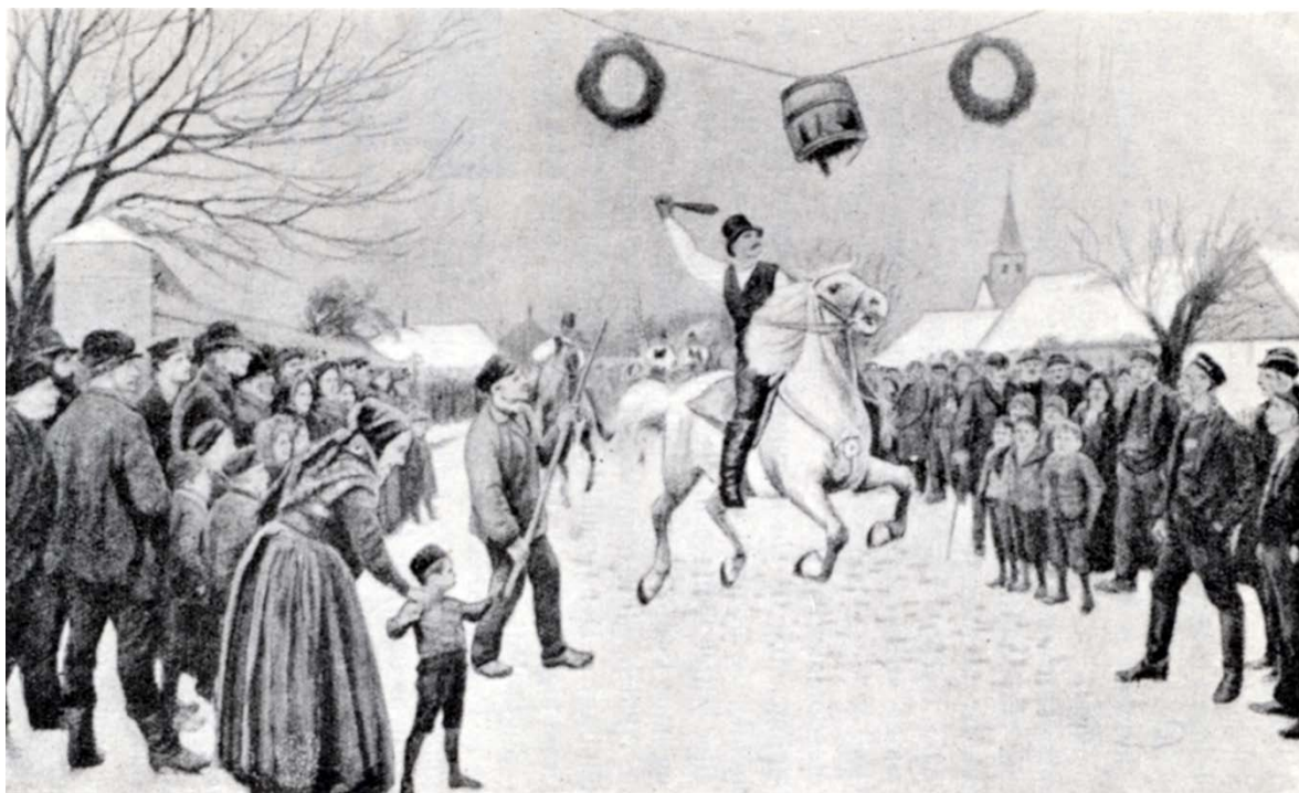
Tønderkongen bliver snart proklameret.

Slutningen paa Gildet var selvfølgelig en Marchvals med Afsyngelse af Nationalsangen og et „Selskabet længe leve“.