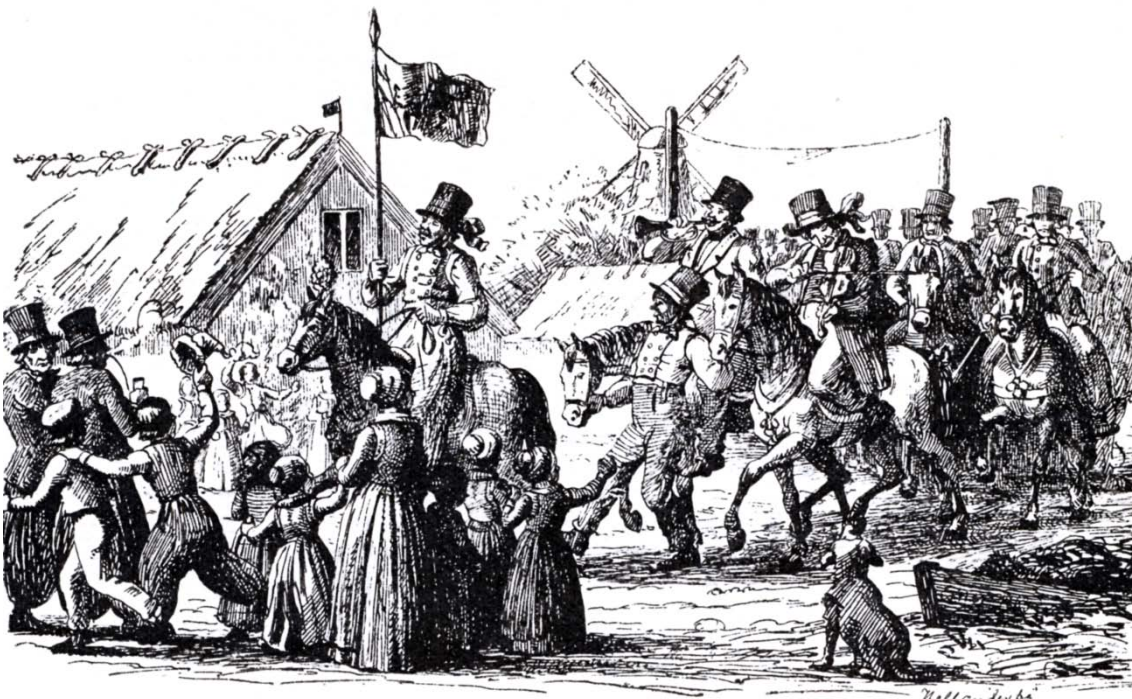
Fastelavnsmandag i Hollænderbyen.

følgende Dage, men det skete paa Køretøjer, hvor Konerne var med, og her vankede ogsaa en Svingom og et lille Traktement; det varede i Reglen til Midnat. Saadanne Visitter gik paa Tur fra det ene Aar til det andet.