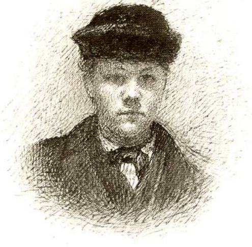
Selvportræt fra læreaårene på Akademiet. 1880-1884.

Den ulykkelige krig med England fra 1801-1807 blev en katastrofe for den danske skibsfart og udslettede næsten Dragørs sejl-skibsflåde. I slutningen af 1870'erne var den dog kommet til kræfter igen, således at Dragør i 1880 regnedes for Danmarks tredjestørste søfartsby. Skibsfartens hovedtrafikåre Drogden myldrede med fartøjer af alle størrelser og typer.