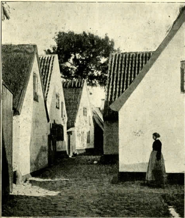
Sol i Strædet.

Svagt og fjernt fra lyder enkelte brudte Toner af Musik. Det er fra Havnen, hvor Ungdommen danser til en ung Fiskers enfoldige Harmonikaspil. Det er Sommernatskoglet i Ungdommens Blod, der giver sig Udslag i denne Dans, og saa er det hele dog kun en Reminiscens fra den store Improvisation forleden Aften, da unge, svenske Sejlsportsmænd kom i Havn og spiste kraftig, dansk Mad med ægte dansk Snaps til og i ungdommeligt Humør revs