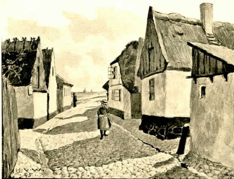
GYDE I DRAGØR.

Smaa haver med klippede Hække og Træ'r Foran de gammeldags, lave Façader, Og toppede Brosten i noget nær En sand Labyrint af Gyder og Gader. Sømærker! — Fyr i det høie Græs, Der Lamperne tænder, naar Dagen hælder! Vidtstrakte Fæl'der — Oaser for Gæs! — Og ikke mindre end tvende Hoteller!