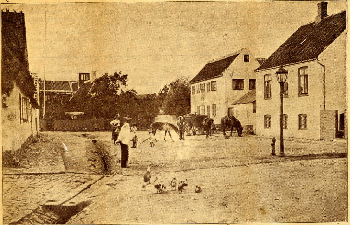
Fogedens Plads. Paa Huset i Baggrunden ses et af Byens mange Udkigstaarne.

Enge, er en komplet Labyrint af krogede Stræder, der slynger sig malerisk omkring smaa Huse med spidse Gavle og straataekte eller teglhængte Tage. Gaderne har en toppet Brolægning med Rendestenen i Midten, og hvert Hus har sin pæne lille Have. Husene er smukt vedligeholdte, Ruderne blankt pudse, Gaderne rent fejede, og alt vidner om Sømandens Sans for Renlighed og Pyntelighed. Man træffer jævnlig paa Gaden løsgaaende Høns, Ænder og Gæs. Navnlig de sidste nyder Livet i Strandkanten og Engdragene, og de lader ikke Verden i Tvivl om, at de eksisterer. Man har kaldt Dragør for »Gæssenes By«, men Ænderne er i Færd med at faa Overtaget. Byens Hovedgade er moderniseret med nette Butikker og Udsalg, Spejlglas og elektrisk Lys, men som Baggrund for disse anerkendelsesværdige Udslag af Nutidens Handelsaand og Vindskibelighed ligger et Par store straataekte Bøndergaarde. Denne Gade fører ned til det store Havnebassin og den rummelige Havneplads med Toldkontor og Lodsbygning etc. samt Strandhotellet med en stor