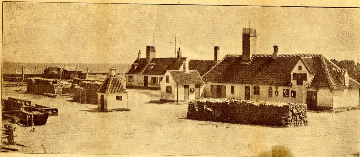
Dragørs Havneplads med »Beghuset« i Midten.

DRAGØR kan med Rette kaldes Amagers Hovedstad. — Alle-rede tidlig i Middelalderen, i Midten af det 13. Aarhundrede, var den kendt og spillede en vigtig Rolle i Sildefiskeriets Guldalder, da den og Skanør og Falsterbo som vigtige Punkter flankerede Indsejlingen til Sundet i Hansetidens Glansperiode. Dengang udfoldede der sig et broget Folkeliv i Dragør. I Sildefiskeriets Højsæson, August og September, opslog hanseatiske og danske Handelsmænd deres Boder her. Ca. 20,000 Mennesker færdedes paa disse Enemærker mellem ca. 700 Boder og opkøbte og handlede med Fisken, saltede og afskibede den, drak Godtøl og fornøjede sig efter bedste Evne i deres Fristunder gennem 300 Aar. Men saa kom Tiden, da Hansestaternes Magt blev brudt, og Sildestimerne gennem Sundet udeblev. Falsterbo sandede til, Skanør blev til en Flække, og Dragør var nu et slet og ret Fiskerleje, som drog Nytte af Københavns Nærhed. Om-trent paa dette Tidspunkt, i 1516, indkaldte Kristjern II. de hollandske