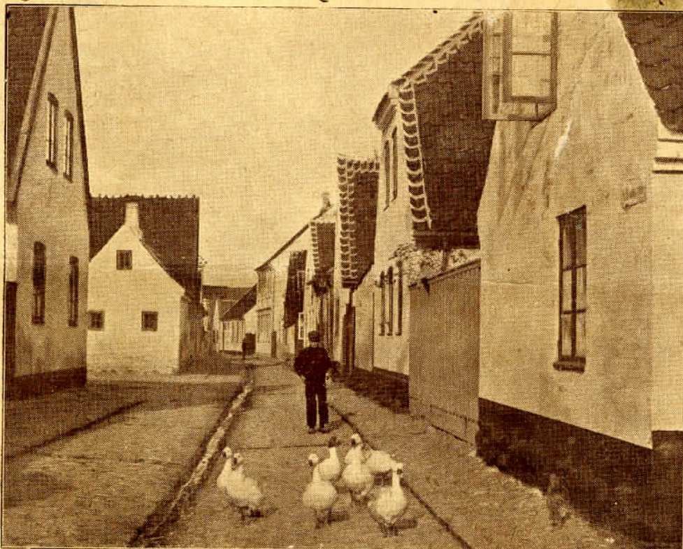
Store Brøndstræde med Gæs i Gaden.

Det gamle Dragør, der er afgrænset af en bred, træbevokset Grønning, som strækker sig helt ud imod Stranden med de flade