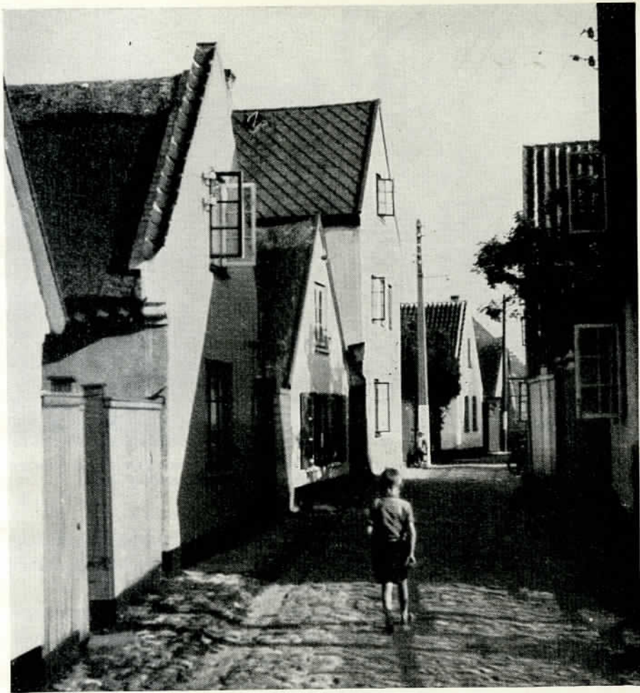
Strandstræde i sommersonne. I det lave hus til venstre dansede dragørerne for et halvt århundrede siden. Pladsen var trang, men alle morede sig. Musikken bestod af en enkelt violin og bas-toner frembragtes ved at skure en stol frem og tilbage på gulvet.

berømte frue ganske vist i sine erindringer, at hun vandrede på sin fod helt til Dragør. Men det, hævder den troværdige gamle Amagermor, kan nu'nte passe, det må være en fejlhuskning. Jeg har kendt damen personlig på hendes ældre dage, og da sagde hun, at det endnu kunne ærgre hende, at hun aldrig nåede så langt som ud til os.