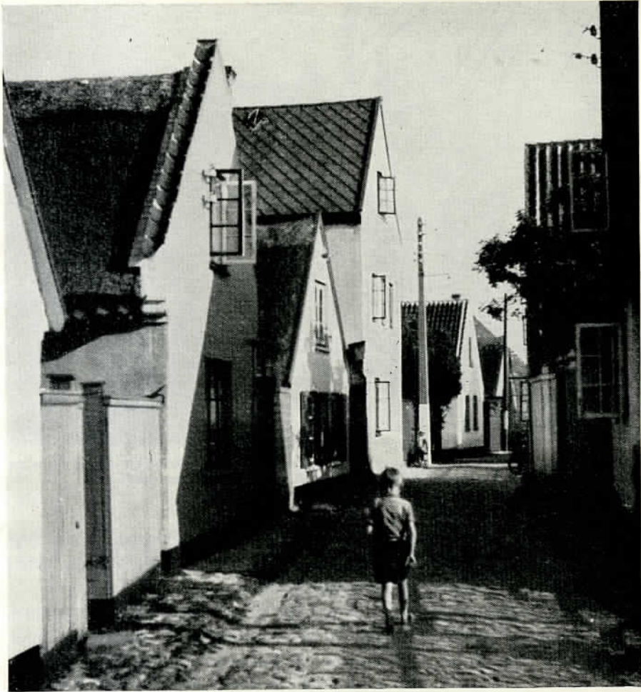
Strandstræde i sommersonne. I det lave hus til venstre dansede dragørerne for et halvt århundrede siden. Pladsen var trang, men alle morede sig. Musikken bestod af en enkelt violin og bas-toner frembragtes ved at skure en stol frem og tilbage på gulvet.

berømte frue ganske vist i sine erindringer, at hun vandrede på sin fod helt til Dragør. Men det, hævder den troværdige gamle Amagermor, kan nu'nte passe, det må være en fejlhuskning. Jeg har kendt damen personlig på hendes ældre dage, og da sagde hun, at det endnu kunne ærgre hende, at hun aldrig nåede så langt som ud til os.