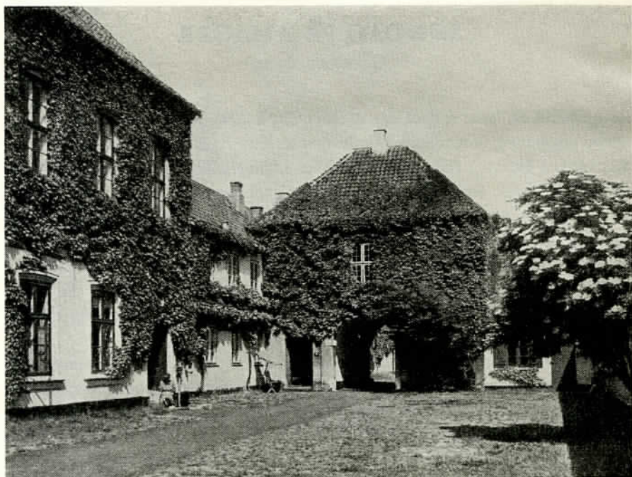
Kastrup slot, opført under Frederik 5. Det kongelige herskab tog ophold her under jagterne på Amager. Senere blev slottet bryggergård, men kongesalen eksisterer endnu.

Fra Tårnby fører den gamle kirkesti, nu bred og gjort ved, tværs over Amager til Kastrup. Hvad får vi mon at se dernede andet end ryggede fabrikkorstene