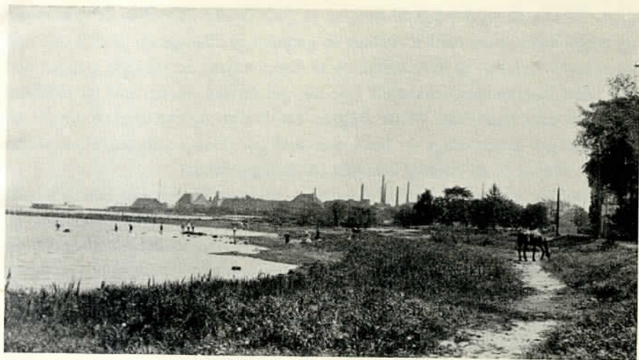
Strandparti fra det gamle Kastrup med havnen i baggrunden. Billedet er fra dengang. Amager strandvej, uhindret af flyvepladsen, førte videre langs sundet til Dragør.