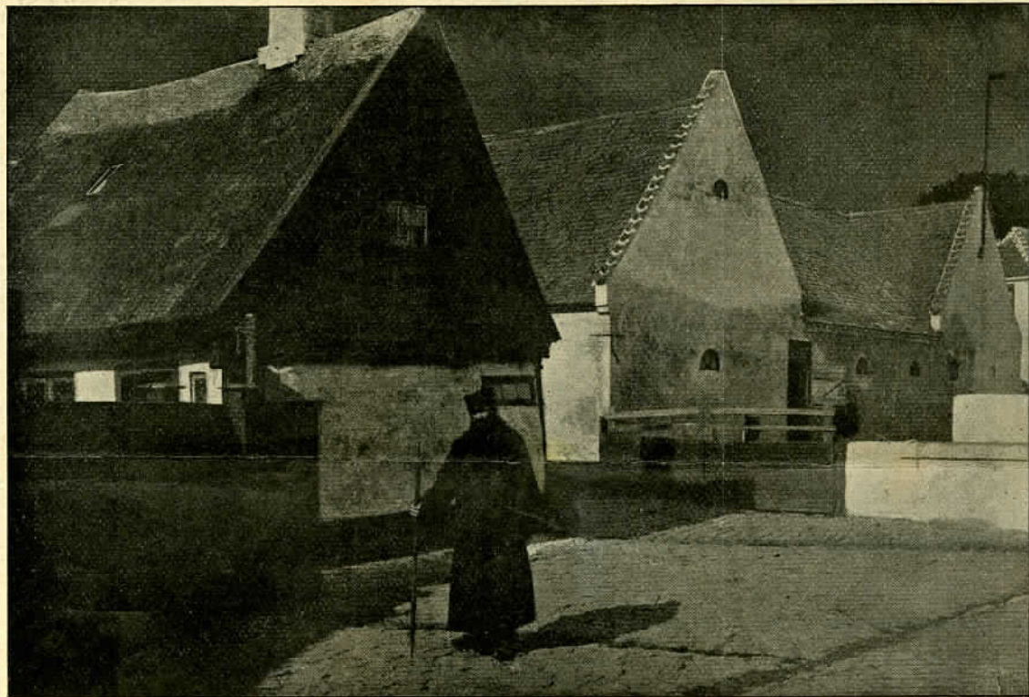
Vægteren paa sin Ronde. (Maaneskin).