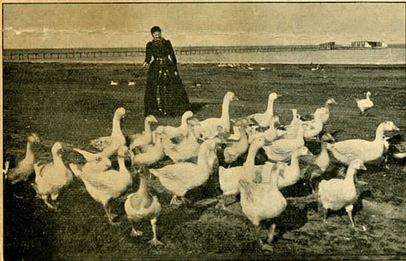
Gæssene drives hjem.

Det er raske Folk, disse Lodser. De taler ikke meget, gør kun nu og da en Bemærkning indbyrdes og lader en Fremmed, der retter et eller andet dumt Spørgsmaal til dem, vente nogen Tid, inden han faar Svar. Men til at krydse ud i en pibende Brandstorm og slaa Kloen i en Lejder, der hænger ned ad en duvende Skudes Side, er ingen bedre end de. Saa er Treven-