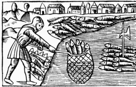
Sildefiskeri i Øresund, den stående hellebard illustrerer sildemængden. Fra Olaus Magnus: Historia om De Nordiska Folken, 1555.

Når de store sildefangster stod på, har man gennem kanalen kunnet fragte sildelasterne op til boderne, hvor rensningen og saltningen fandt sted. Antagelig er det foregået i fladbundede pramme, svarende til den der er blevet fundet i Falsterbo i volden omkring »Falsterbohus«.