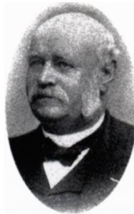
F. J. Madsen (Dragør Lokalarkiv).

De kom begge til byen fra andre egne af landet i slutningen af forrige århundrede, og som det går i et lille traditionsbundet, stillestående samfund, tog disse »fremmede« initiativer, som måske ikke altid blev vel modtaget af de »indfødte«.