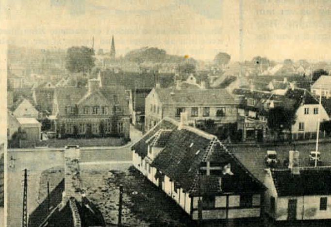
Dragør er fiskernes by og lodsernes by. Og fra gammel tid er det ogsaa plankeværkerens by; lykkes det at faa et kig indenfor kan man godt faa øje paa en gammel halvdør fra 1700tallet eller en smuk rokokodør med tykmavede fyldinger. — Men det er ogsaa gæssenes by — det passer dem ikke altid selv at finde hjem ...

Og Dragør har sendt sine sønner ud. Baade dem, der for paa varmen og stadig vendte tilbage, og dem, der bosatte sig i det