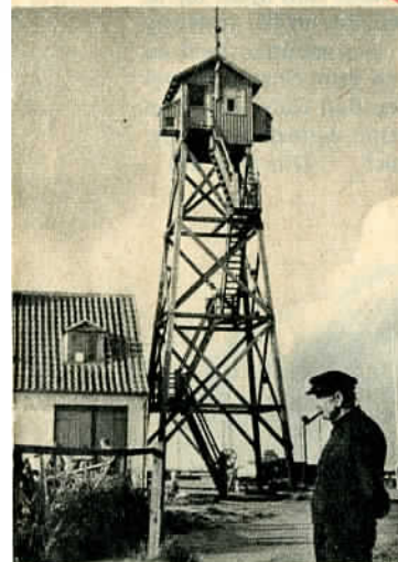
Et kolonihavehus paa stykker er Dragør-lodsens vagttaarn ...

Skal vi starte og tage turen i omvendt orden: Først gaa en tur til Dragør!