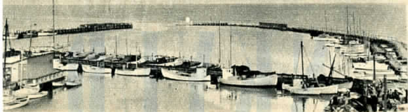
I havnen ligger hverdagslige fiskekuttere og flotte lystyachter side om side. Paa solrige dage støvner de ud og hvidspætter det blaa sund

WESTRE BOULEVARD i København skal udvides og have navneforandring. Dragespringvandet skal flyttes. — Der maales og beregnes — der diskuteres og drikkes øl — det gaar med lodder og trisser. Det tager sin tid dette her set med uøvede øjne, og det trækker tilskuere. Mange tilskuere. Klokkeren er 1 om eftermiddagen.