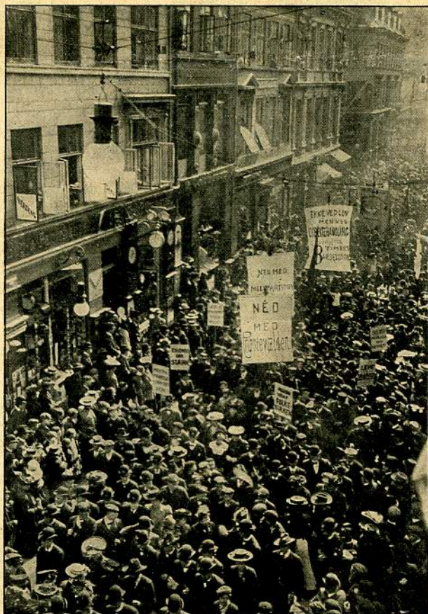
Socialdemokraternes Tog passerer „Verdens-Spejlet“.

Socialdemokraternes Majdemonstration, der i tidligere Aar har været henvist til de Dele af Byen, der ligger udenfor det gamle Voldkvarter og Fælledeerne,