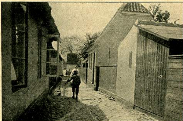
Brøndstræde i Dragør.

Saaledes som Byen laa for Hundrede af Aar siden, ligger den i Hovedsagen endnu og venter paa det vidunderlige. Og det kommer vel en skønne Dag, naar den meget omdisputerede Amagerbane omsider faar sat Dampen op, og saa bliver Dragør vel et nyt, moderne Badested, maaske mere endnu: en Badeby for hele den betrængte Middelstand udi det ganske Køben-