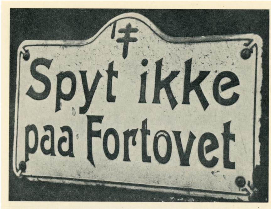
Nationalforeningen fik ved hjælp af de indsamlede midler opført adskillige sanatorier landet over. Som et led i det præventive arbejde, satte foreningen skilte op på gaderne som dette op for at begrænse smitten.

Nationalforeningen oprettede sanatorier hvor de smitteramte patienter kunne behandles. Som en del af det forebyggende arbejde, oprettede foreningen tuberkulosestationer, hvor folks lunger blev gennemlyst, så man kunne opdage tuberkulosen på et tidligt stadium. På Amager Landevej, over for det nuværende Tårnby Rådhus, lå en sådan tuberkulosestation. Foreningen drev også mobile klinikker, de såkaldte røntgenbiler, der kørte ud til arbejdspladser og undersøgte medarbejderne. Det gjaldt især på skoler og andre institutioner, hvor personalet var i tæt kontakt med mange mennesker.